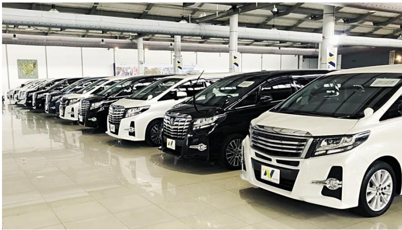
ナザ・モーター・トレーディングのショールーム。ENGが輸出した車両が並ぶ

2018年の売上は、前年より40%増加した267億円を達成しました。この理由は、マレーシアでの政策変更による輸出台数の増加と、日本国内での中古車買取事業の好調であると考えています。